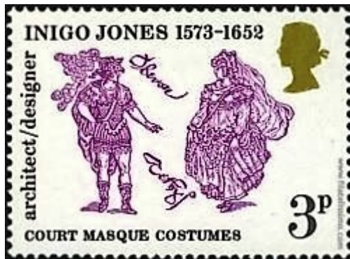
Yvert & Tellier # 691

Volviendo al tema de los sellos, el correo británico lanzó en 1973 una serie de cuatro sellos conmemorativos del maestro Jones, de 3 y 5 peniques de valor facial. Las dimensiones son de 30 x 40 mm. en formato apaisado y no se consigna referencia alguna acerca del autor del diseño. El sistema de impresión utilizado es offset tricromático: el verde olivo y ocre se reiteran como colores constantes en todos los diseños, tanto para el texto como para la clásica efigie de la Reina Isabel II; en tanto que el magenta, el azul, el ocre y el verde oscuro son las tonalidades variables de cada uno de los cuatro motivos. ( Yvert & Tellier # 691, 692, 693 y 693-1.)