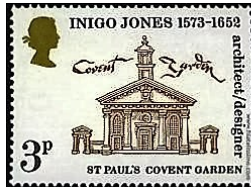
Yvert & Tellier # 692