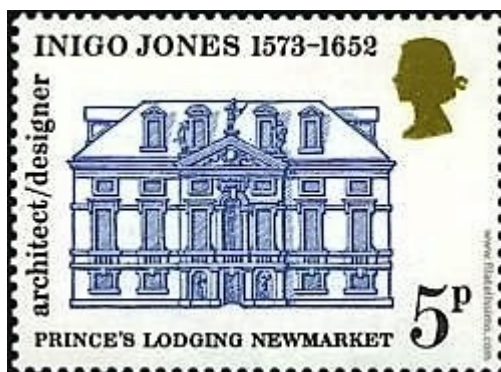
Yvert & Tellier # 693