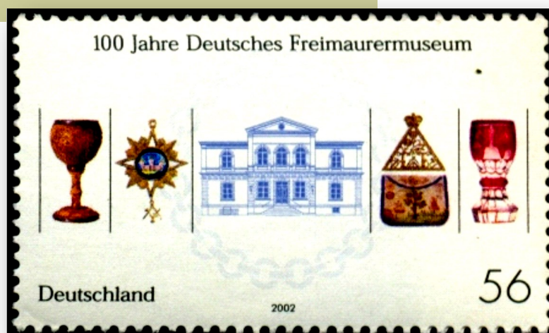
Alemania (2002), Yvert & Tellier #2076

puede considerarse, con razones suficientes, que Alemania conforma, junto con Francia y el Reino Unido, la trilogía de países del mundo con la más extensa tradición y presencia masónica.