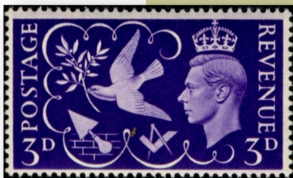
Gran Bretaña (1946), Yvert &amp; Tellier #236

A pesar de que la masonería moderna tuvo sus orígenes en las islas británicas, y que hasta hoy en día cuenta entre sus miembros a destacados integrantes de la familia real inglesa, la edición de sellos postales sobre temática masónica en el Reino Unido ha sido casi inexistente.