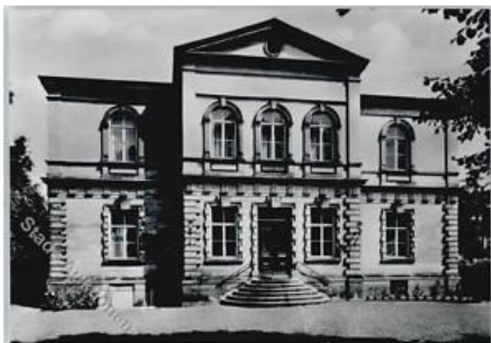
Fachada histórica del Bayreuth Freimaurer Museum.

En 1933, con el advenimiento del nazismo, el museo fue clausurado y saqueado. Su extenso patrimonio fue enviado a la Oficina Central de Seguridad del Reich en Berlín y a otros diversos lugares, mientras transcurría la segunda gran guerra europea. Durante todo este período se extraviaron más de 1.000 joyas y medallas de Logias, alfombras, óleos y cerca de 15.000 sellos.